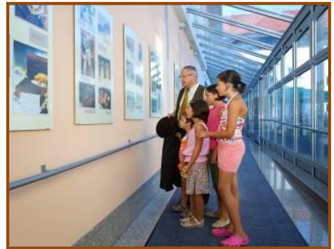
Stalna čebelarska razstava

Programi čebelarskega turizma so vključeni tudi v druge projekte, sofinancirane z evropskimi sredstvi, ki so še v izvajanju. Občina Laško ima v svojem proračunu vsako leto zagotovljena sredstva za ohranjanje in razvoj kmetijstva in podeželja občine Laško, s katerimi sofinanciramo izobraževanje, promocijo in ostale aktivnosti Čebelarskega društva Laško.