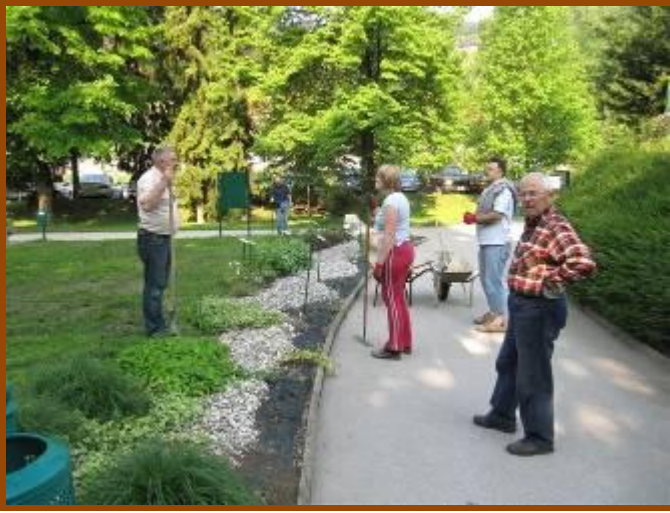
Priprava vrta in zasaditev medovitih rastlin