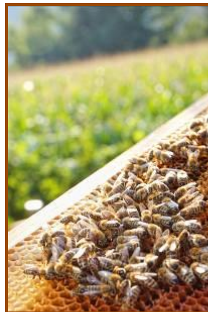
Občina Laško – območje brez GSO

Občinski svet Občine Laško je na 6. seji, 4. 7. 2007, obravnaval predlog za razglasitev Občine Laško za območje brez gensko spremenjenih organizmov in župan Občine Laško je podpisal izjavo Občina Laško – območje brez GSO .