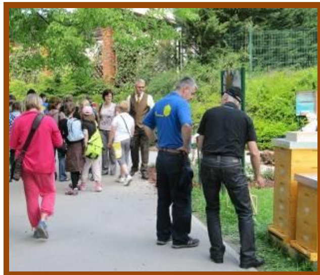
XXXV. državno srečanje in tekmovanje mladih čebelarjev v Laškem