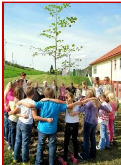
Otvoritev čebelnjaka pri podružnični OŠ v Šentrupertu pri Laškem