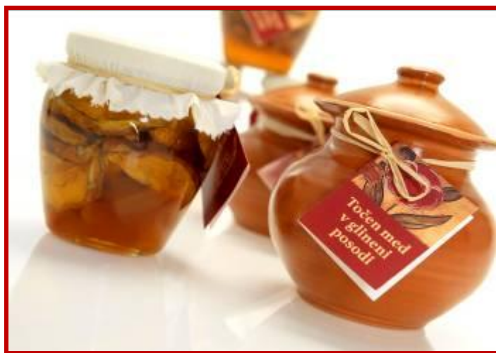
Različne vrste medu laških čebelarjev

Predstavniki Čebelarškega društva Laško otrokom v vrtcu pokažejo, kako pridobivamo čebelje izdelke, predvsem med. S seboj prinesejo nekaj osnovne čebelarške opreme, otrokom pa je običajno najbolj zanimiva polna satnica medu. Medenemu zajtrku vedno prisostvuje tudi župan, ki skupaj z otroci prisluhne naukom čebelarških mojstrov. Otroci se naučijo, na kakšne načine se med uporablja, zakaj čebela piči, kaj storiti po piku in še mnoge druge zanimivosti. Med in medeni izdelki tako postanejo še bolj okusni in zanimivi kot po navadi.