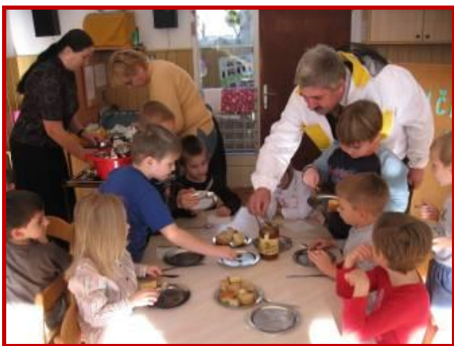
Pokušina medu laških čebelarjev na tradicionalnem slovenskem zajtrku v Vrtcu Laško

K vseslovenski akcije čebelarjev, v sklopu katere obiskujejo vrtce in osnovne šole ter predstavljajo dejavnost čebelarstva in namen katere je osveščanje prebivalcev v skrbi za čisto okolje in pomenu ohranjanja čebel v naravi, smo pristopili tudi v Občini Laško.