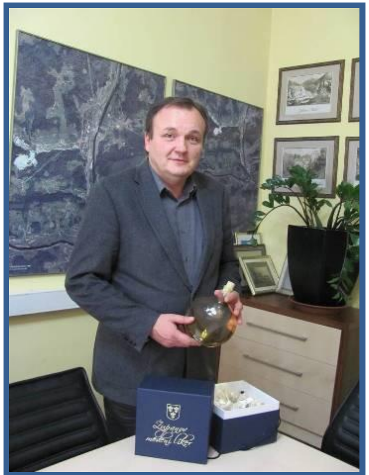
Protokolarno darilo Občine Laško – Županov medeni liker