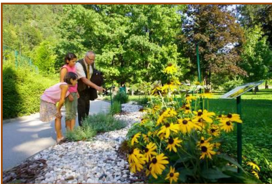
Vrtovi medovitih rastlin v zdraviliškem parku in pri čebelarjih so zelo dobro obiskani

V Občini Laško imamo 110-letno tradicijo čebelarstva društvenega organiziranja. Zavedamo se pomena ohranjanja čistega in biotsko raznovrstnega avtohtonega okolja, zato se zanj tudi aktivno zavzemamo. Naša prizadevanja zajemajo tudi spodbujanje prenosa znanja o zdravilnih in medonosnih rastlinah ter o nujnosti njihovega obstoja tudi v prihodnje. Posredovanje znanja o čebelarstvu skozi razvoj čebelarstva turizma aktivno podpiramo. V ta namen smo v letu 2008 sodelovali pri zasnovi in izvedbi projekta Spoznajmo čebelarstvo dediščino , čigar nosilec je bilo ČD Laško, partnerji pa ČD Celje in ČD Vojnik. V okviru projekta so bili oblikovani in zasajeni 4 vrtovi medovitih rastlin (še eden se jim je priključil kasneje), ki bodo v bodoče povezani v čebelarstvo učno pot. Glavni nameni projekta, ki je uspešno kandidiral za evropska sredstva LEADER preko LAS Raznolikost podeželja, so bili: