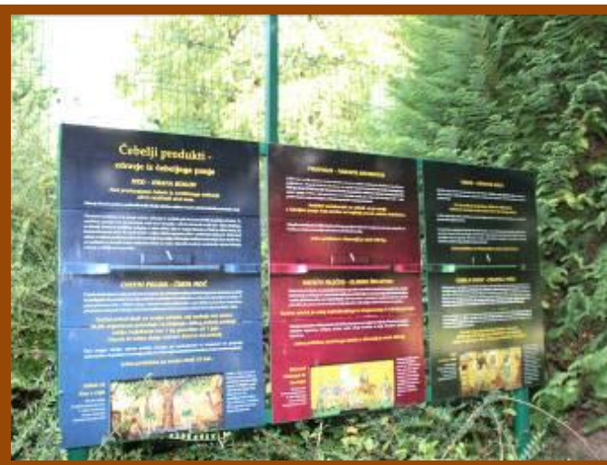
Predstavitve čebelarstva na tablah v parku