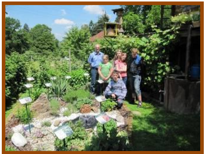
Vrt pri enem od čebelarjev