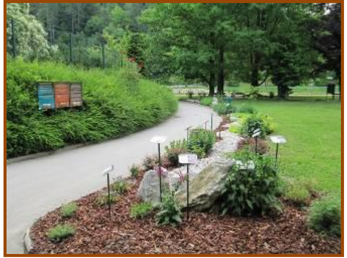
Označitev rastlin z informativnimi tablicami