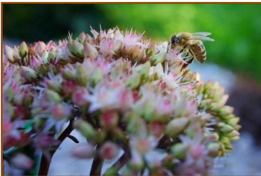
V Občini Laško skrbimo za zasajanje medovitih rastlin na javnih površinah

V skladu z zgornjim dokumentom v Občini Laško skrbimo, da na javne površine zasajamo avtohtone in medovite rastline, saj verjamemo, da s tem prispevamo k nadaljnjemu razvoju čebelarstva in čebelarskega turizma v občini Laško.