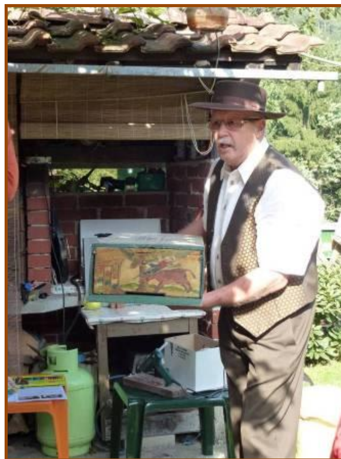
Knjižna kazalka, nastala na delavnici pri čebelarju