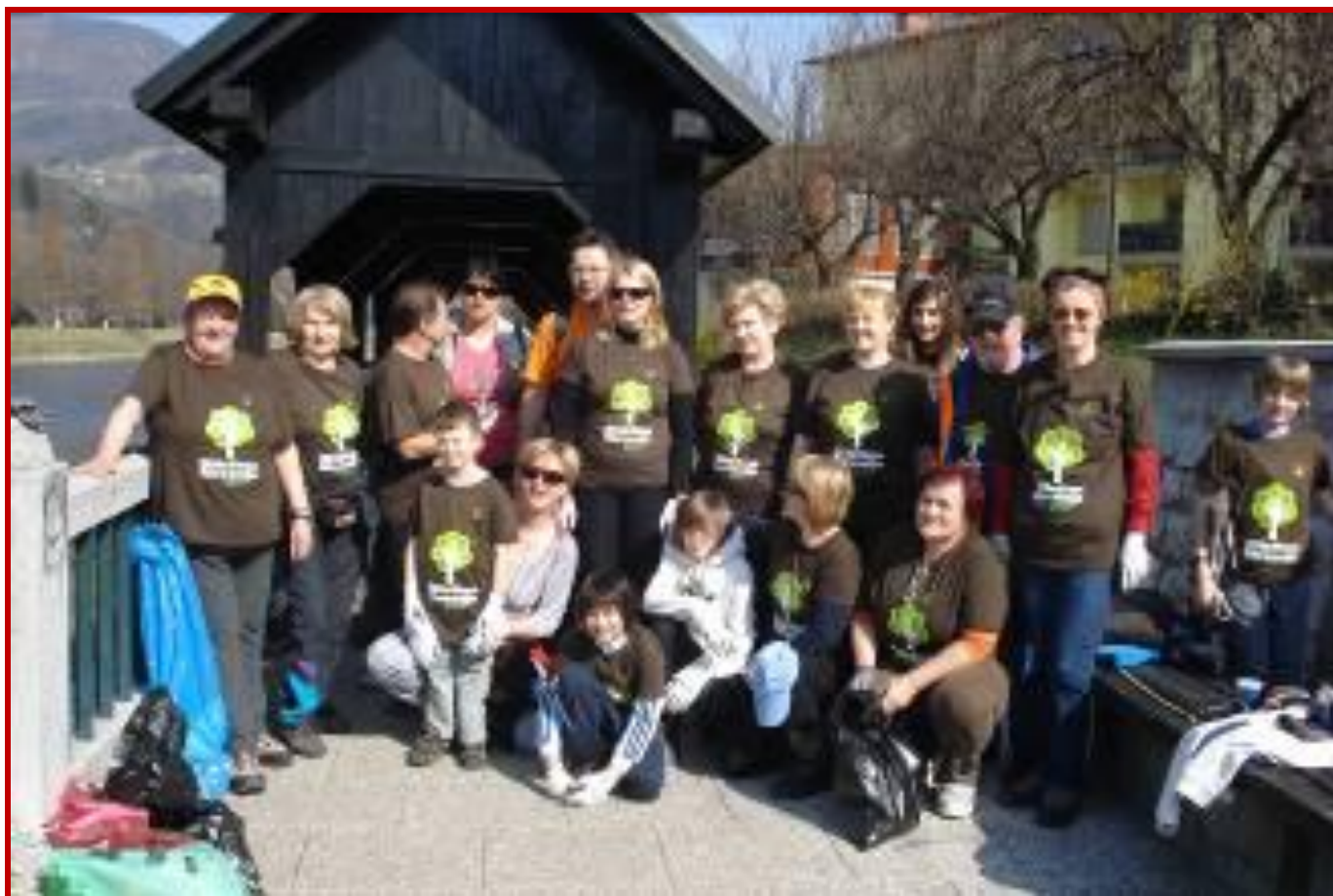
Ob zaključku akcije Očistimo Slovenijo

Tudi v letošnjem letu se je Občina Laško udeležila čistilne akcije "Očistimo Slovenijo v enem dnevu 2012". Tako so v zadnjem mesecu potekale intenzivne priprave, sestanki in logistična organizacija celotne akcije. Občina Laško je v sklopu te akcije priskrbelo opremo (rokavice, vrečke, malica ...) za vse udeležence.