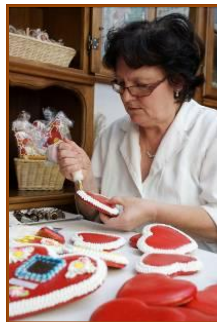
Izdelovanja lectov v Čebelarstvu Šolar