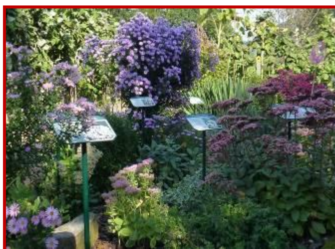
Spoznajmo bogastvo čebelarstva dediščine