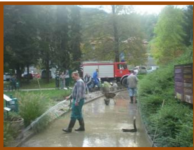
Akcija obnove vrta po poplavi